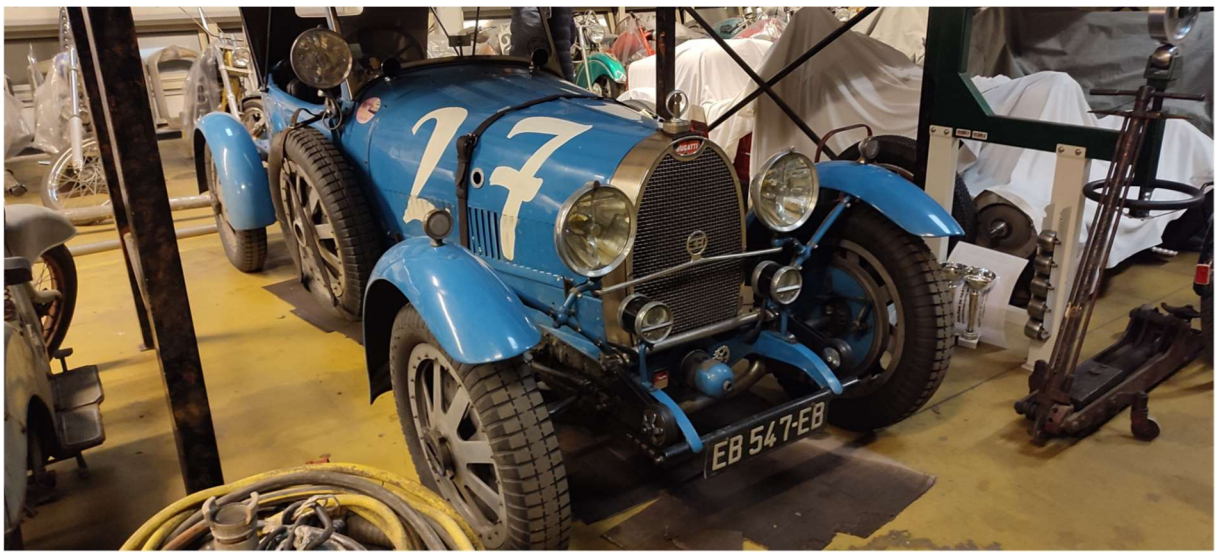
Un peu plus loin, nous entrons dans un hall rempli de pièces