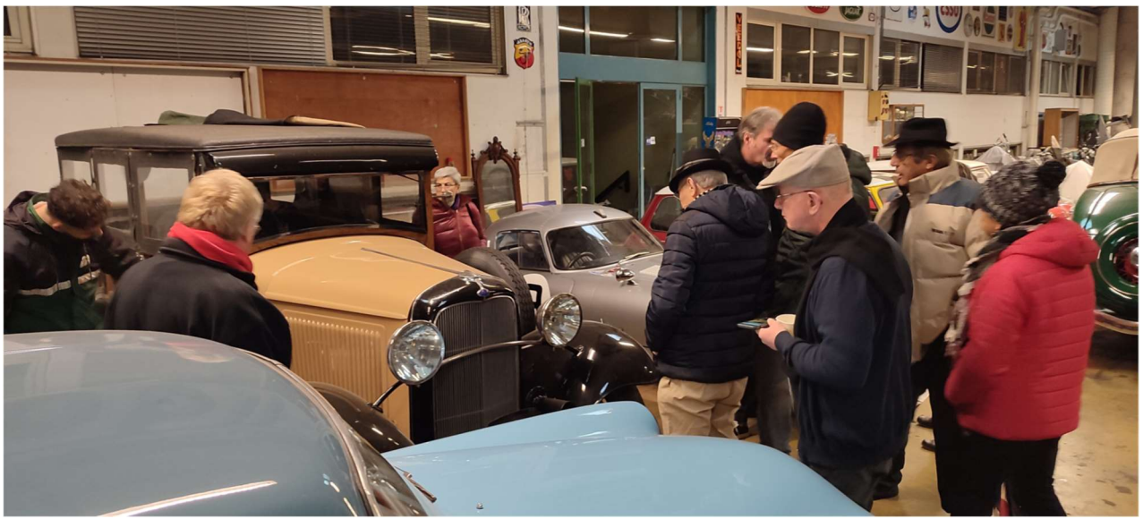
Un peu plus loin, des mini et Jaguar